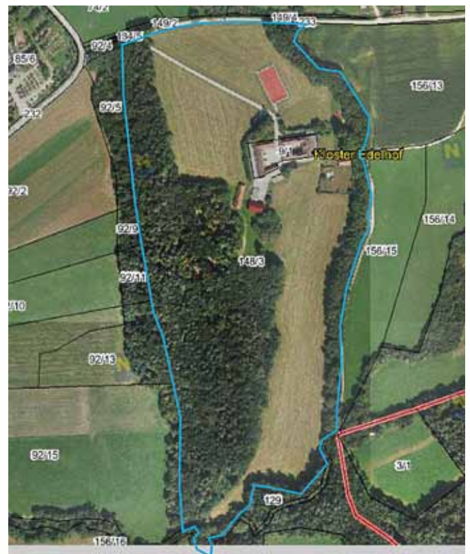
Das Anwesen liegt nur rund 1,5 km vom Rohrbacher Ortszentrum entfernt.

Im Hauptgebäude werden Wohneinheiten für Menschen aller Generationen geschaffen, die gemeinsam leben und arbeiten wollen. Die Bewohner_innen sind Säulen-träger des Gemeinschaftswohnprojekts sowie der Angebote am LebensGut.